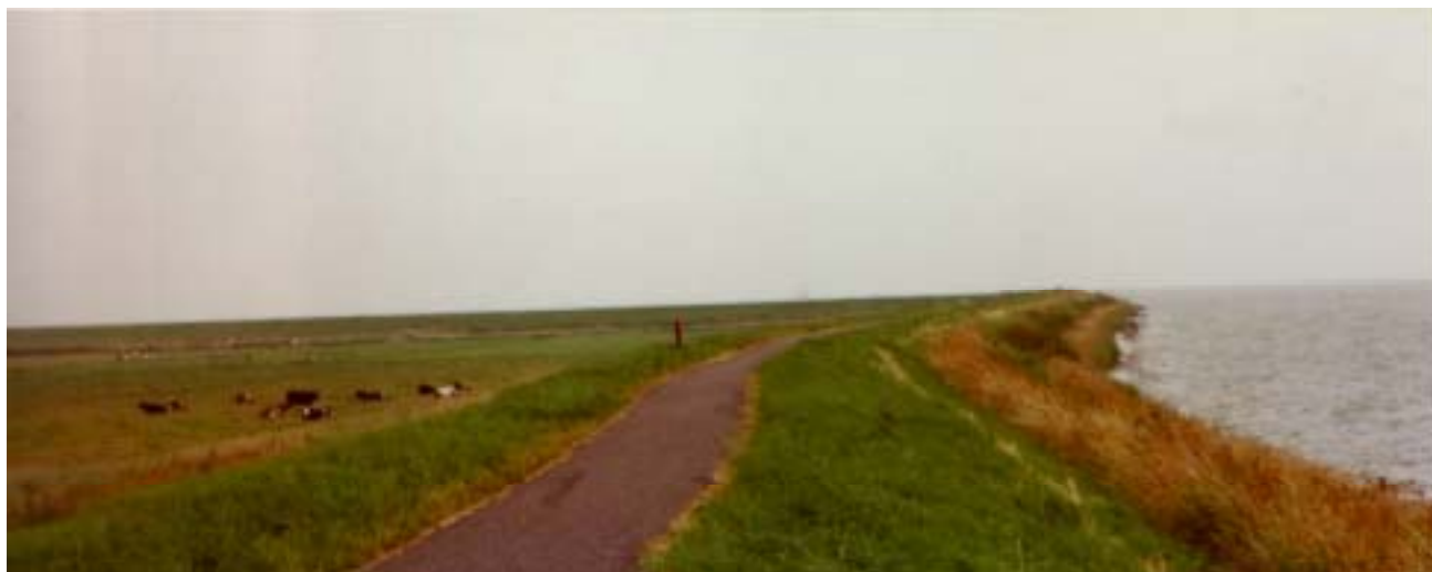
Het ringslangtraject bij Uitdam