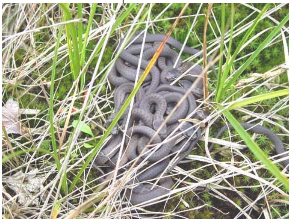
Cluster juveniele gladde slangen op de Kalmthoutse heide (B) in 2000.

We konden met eigen ogen zien dat de jonkies dit jaar niet clusteren. In totaal zagen we naast zeven adulte dieren ook zeven juvenielen die allen eenzaam en alleen over de Peel zwierven. Uit het Fochteloërveen ontvingen wij dezelfde berichten. Een goed gladde slangen jaar derhalve. Goed voor de slangen, minder voor de waarnemer want clusters zijn veel gemakkelijker te vinden dan een enkel jonkie!