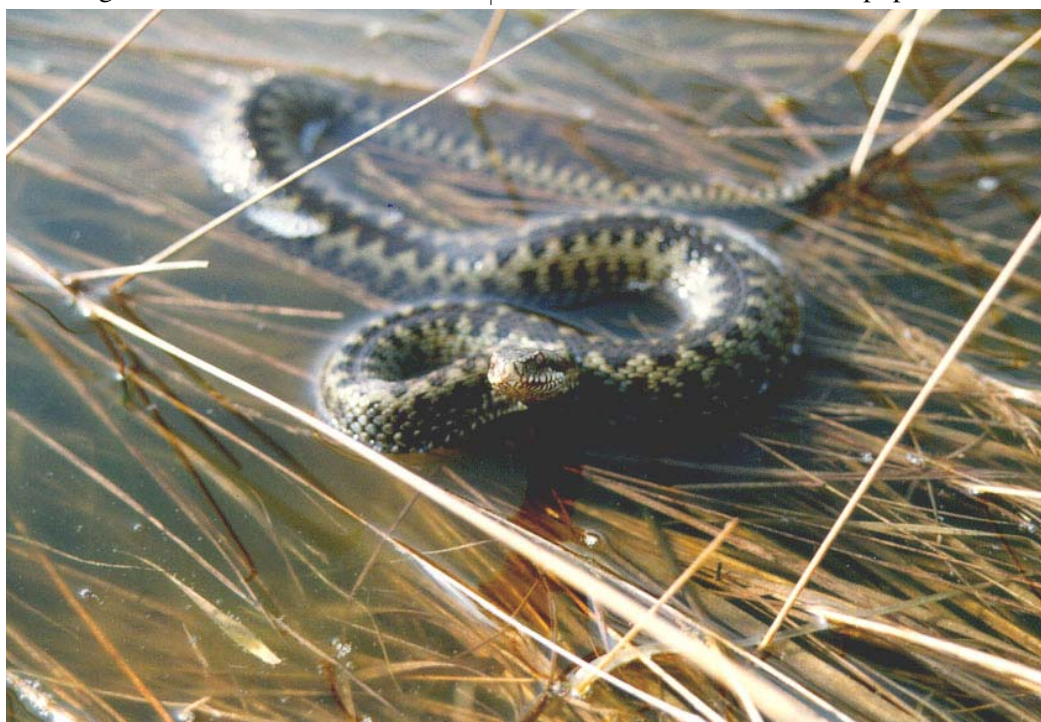
Adder in laag water