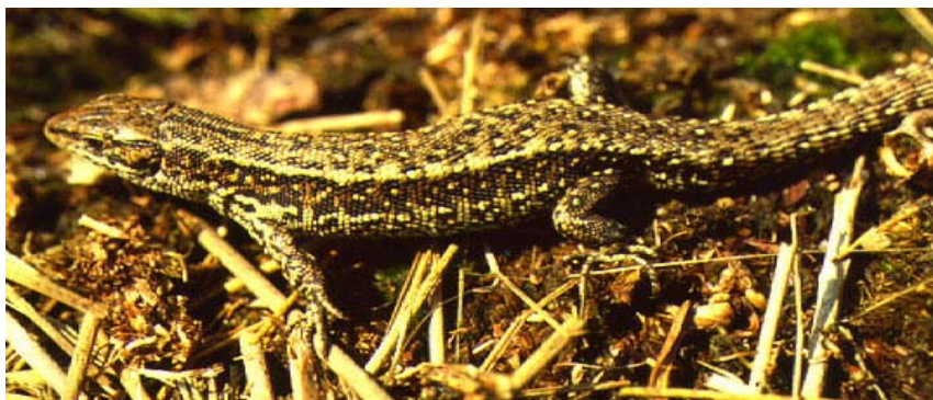
Mannetje (boven) en vrouwtje (onder) levendbarende hagedis.