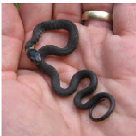
Kuinderbos 20 augustus 2007