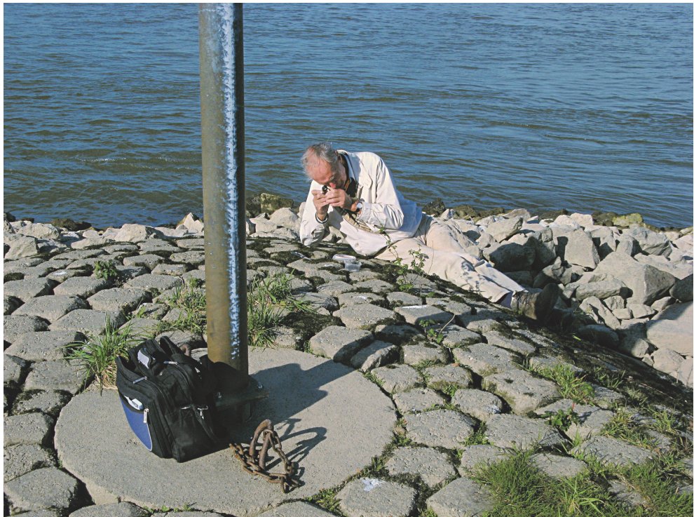
Afbeelding 3. Aan de Waal bij Wamel, omstreeks 2008.