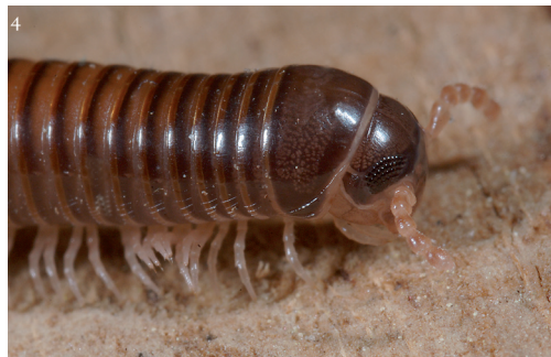
Figuur 1-4. Aulonopygus aculeatus uit Blijdorp (2006). 1. habitus, 2. opgerolde houding na verstoring, 3. achterkant, 4. kop en collum.