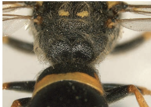
Figuur 2. Achterwand van het propodeum glimmend. Figure 2. Posterior face of the propodeum shiny.