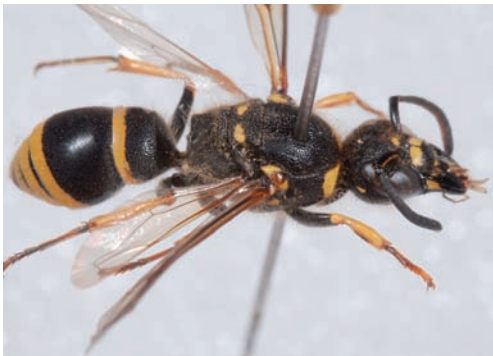
Figuur 1. Ancistrocerus antilope , vrouwtje. Figure 1. Ancistrocerus antilope , female.

Van het genus Ancistrocerus komen in ons land 12 soorten voor. Daarvan is A. antilope de grootste soort; mannetje 10-13 mm, vrouwtje 13-16 mm (fig. 1). Het is de enige soort waarvan de achterwand van het propodeum vettig glanzend is en slechts weinig grof gestructureerd (fig. 2). De andere Ancistrocerus -soorten hebben allemaal een dichte, grove structuur op de achterwand van het propodeum, die er daardoor mat uitziet. Ook de zijwanden van het propodeum zijn bij Ancistrocerus antilope glad en vettig glanzend, evenals de metapleuren. Deze kenmerken zijn met het blote oog niet te zien, daarvoor is er op zijn minst een loep nodig of een binoculair.