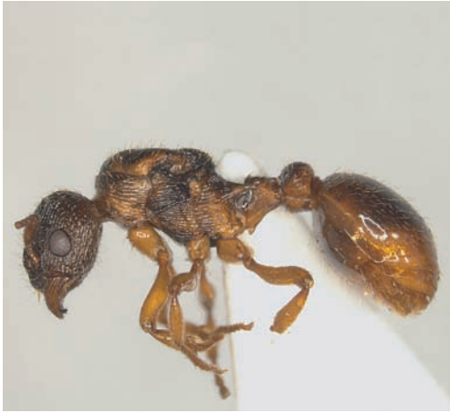
Figuur 3. Het Nederlandse exemplaar van Myrmica vandeli .