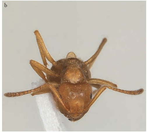
Figuur 2. Het Nederlandse exemplaar van Lasius jensi . a. Zijaanzicht, b. vooraanzicht, met karakteristieke vorm van schub.