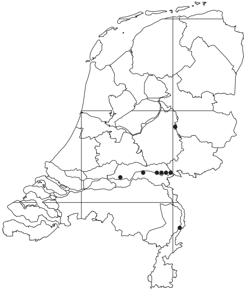
Figuur 3. Vindplaatsen van Ptenothrix ciliata in Nederland.