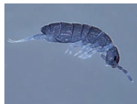
Desoria trispinata

Cyphoderidae Cyphoderus albinus Entomobryidae Entomobrya lanuginosa Entomobrya multifasciata Entomobrya nivalis Heteromurus major Heteromurus nitidus Lepidocyrtus lignorum Orchesella cincta Willowsia platani Isotomidae * Desoria trispinata