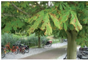
Paardenkastanje met paardenkastanjemineermot Cameraria ohridella

Bryotropha terrella Chrysoesthia sexguttella rupsen en lege mijnen op Chenopodium album Metzneria lappella Geometridae Campptogramma bilineata Gestreepte goudspanner Dysstroma truncata Schimmelspanner Eupithecia assimilata Hopdwegspanner Eupithecia virgaureata Guldenroededwegspanner Gymnoscelis rufifasciata Zwartkamdwegspanner Idaeia aversata Grijsje stipspanner Idaeia dimidiata Vlekstipspanner Peribatodes rhomboidaria Timandra comae Lieveling Xanthorhoe spadicearia Glyphipterigidae Glyphipterix simplicella Gracillariidae Caloptilia elongella lege mijn op Alnus glutinosa Caloptilia stigmatella mijnen op Salix alba Cameraria ohridella Paardenkastanjemineermot mijnen algemeen op Aesculus hippocastanum naast Pesthuis sinds 2002