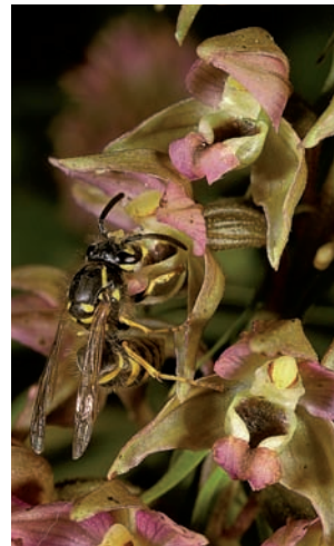
Brede wespenorchis Epipactis helleborine

Epipactis helleborine Brede wespenorchis