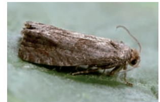
Epiblema turbidana

Pieridae Pieris napi Klein geaderd witje Pieris rapae Klein koolwitje Pterophoridae Adaina microdactyla Emmelina monodactyla Pyralidae Aphomia sociella Trachycera advenella Stathmopodidae Stathmopoda pedella Tineidae Nemapogon cloacella Tischeriidae Coptotriche marginea mijnen op Rubus fruticosus Tortricidae Acleris forsskaleana Acleris hastiana Aleimma loeflingiana Archips podana Grote appelbladroller Bactra lancealana Celypha lacunana Brandnetelbladroller Celypha striana Clepsis consimilana Clepsis spectrana Koolbladroller Cochyliis atricapitana Cydia splendana Okkernootmot Dichrorampha flavidorsana Dichrorampha plumbana Dichrorampha simpliciana Epiblema foenella Epiblema turbidana