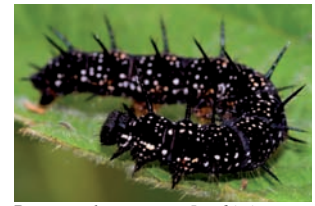
Rups van daggauwoog Inachis io Foto: John T. Smit

Hypena proboscidalis Bruine snuituil Lacanobia oleracea Groente-uil Luperina testacea Gewone grasuil Macdunnoughia confusa Mamestra brassicae Kooluil Mesapamea didyma Weidehalmuiltje Mesapamea secalis Halmrupsvlinder Mesologia furuncula Mythimna l-album Witte-l-uil Mythimna straminea Spitsvleugelgrasuil Naenia typica Splinterstreep Noctua comes Volgeling Noctua interjecta Kleine huismoeder Noctua janthe Open-breedbandhuismoeder Noctua janthina Kleine breedbandhuismoeder Noctua pronuba Huismoeder Oligia strigilis Orthosia incerta Variabele voorjaarsuil Paradrina clavipalpis Huisuil Parastichtis ypsilon Phlogophora meticulosa Rhizodra lutosus Herfst-rietboorder Rivula sericealis Stro-uiltje Schrankia costaeistrigalis Gepijlde micro-uil Xanthia ocellaris Populierengouduil Xestia c-nigrum Zwarte-c-uil Xestia xanthographa Vierkantvlekuil Notodontidae Clostera curtula Nymphalidae Aglais urticae Kleine vos Inachis io Daggauwoog Maniola jurtina Bruin zandoogje Pararge aegeria Bont zandoogje Vanessa atalanta Atalanta Oecophoridae Crassa unitella Hofmannophila pseudospretella