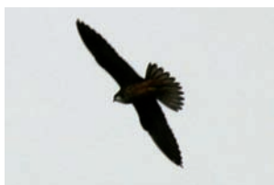
Slechtvalk Falco peregrinus

Falco peregrinus Slechtvalk Falco subbuteo Boomvalk Falco tinnunculus Torenvalk