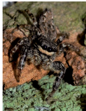
Schorsmarpissa Marpissa muscosa