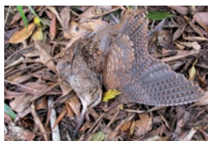
Hootsnip Scolopax rusticola

Larus argentatus Zilvermeeuw Larus canus Stormmeeuw Larus fuscus Kleine mantelmeeuw Larus ridibundus Kokmeeuw Sterna hirundo Visdief Scolopacidae Gallinago gallinago Watersnip Scolopax rusticola Houtsnip