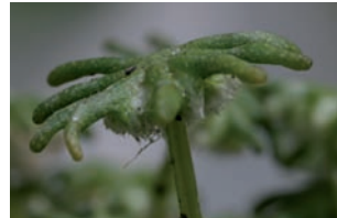
Parapluitjesmos Marchantia polymorpha