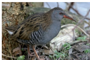
Waterral Rallus aquaticus

Fulica atra Meerkoet Gallinula chloropus Waterhoen Rallus aquaticus Waterral