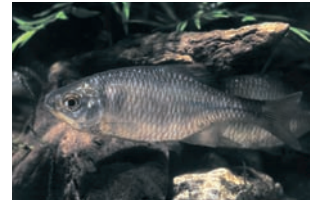
Bittervoorn Rhodeus amarus

Abramis bjoerkna Kolblei Ctenopharyngodon idella Graskarper Cyprinus carpio Karper Leuciscus cephalus Kopvoorn Perca fluviatilis Baars Rhodeus amarus Bittervoorn