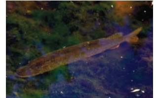
Snoek Esox lucius