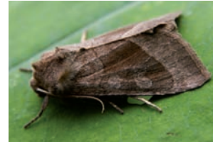
Groothoefbladboorder Hydraecia petasitis

Autographa gamma Gamma-uil Caradrina morpheus Morpheusstofuil Chilodes maritima Smalvleugelrietboorder Cosmia trapezina Hyena Diachrysa chrysitis Diarsia rubi Gewone breedvleugeluil Hadena bicurris Gewone silene-uil Hoplodrina ambigua Hydraecia micacea Aardappelstengelboorder Hydraecia petasitis Groot-hoefbladboorder