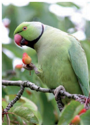
Halsbandparkiet Psittacula krameri

Anthus pratensis Graspieper Motacilla alba Witte kwikstaart Motacilla flava Gele kwikstaart