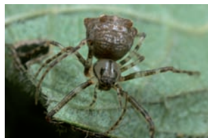
vierspitspinneneter Ero aphana

muscosa , de grootste springspin (Salticidae) in Nederland. Het is een niet echt zeldzame soort die ook rond huizen kan worden aangetroffen, tegenwoordig wordt de soort vaker waargenomen dan vroeger, met name in de stedelijke omgeving.