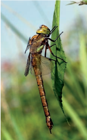
Vroege glazenmaker Aeshna isocles

Aeshna mixta Paardenbijter Anax imperator Grote keizerlibel