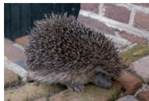
Egel Erinaceus europaeus