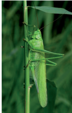
Grote groene sabelsprinkhaan Tettigonia viridissima

Conocephalus dorsalis Gewoon spitskopje Meconema meridionale Zuidelijke boomsprinkhaan Tettigonia viridissima Grote groene sabelsprinkhaan