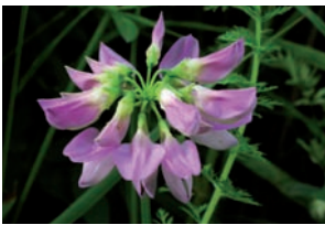
Bont kroonkruid Securigera varia

Lathyrus pratensis Veldlathyrus Lotus corniculatus Gewone rolklaver en rechte rolklaver Medicago lupulina Hopklaver Melilotus albus Witte honingklaver Melilotus altissimus Goudgele honingklaver Securigera varia Bont kroonkruid