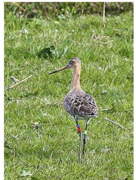
Carel de Vink