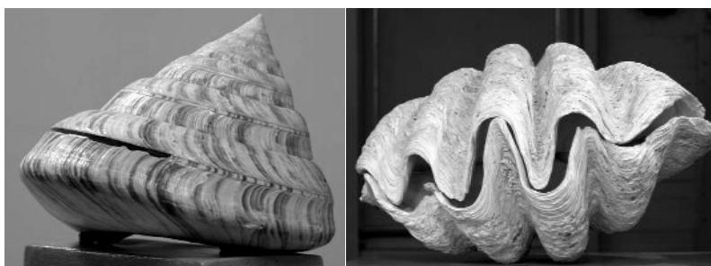
Pronkst ukken: Entemnotrochus rumphii (Schepman, 1879) en Tridacna gigas (L., 1758)