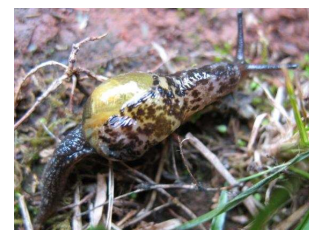
Voorplaat / Cover plate

Phenacolimax marcidus (GOULD, 1848) – Madeira (September 2007).