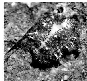
Voorplaat / cover

Living / Levende Cypraea moneta Indonesia, Bali, Sanur 1993