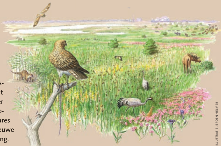
ILLUSTRATIE: JEROEN HELMER

Onder regie van het Regionaal Landschap Kempen en Maasland en ARK is in het Kempen~Broek een gebiedsontwikkeling gestart, die zich in een aantal opzichten onderscheidt van klassieke vormen van landinrichting. Overheidsplannen voor natuur, landbouw, recreatie en waterbeheer worden hier mét en door de streek zelf uitgevoerd. Het is vooral te danken aan de beide Provincies Limburg, die het aangedurfd hebben om particuliere organisaties hierbij het voortouw te geven. De rol van de overheid beperkt zich tot die van opdrachtgever die achteraf toetst. Via het mechanisme van de vrijwillige kavelruil en gebruikmakend van een grondbank zijn binnen enkele jaren tijd meer dan 600 hectare van eigenaar verwisseld. Successen worden met de streek gevierd en zo wordt gestaag gewerkt aan een groeiend vertrouwen tussen zowel overheid en particulieren, als tussen de verschillende ruimtegebruikers in het gebied. Boeren krijgen betere gronden rond het bedrijf toegevoegd en leveren daarvoor veldkavels in die midden in natuurgebieden gelegen zijn. Daardoor ontstaan grotere, aaneengesloten natuurterreinen, waar het water-