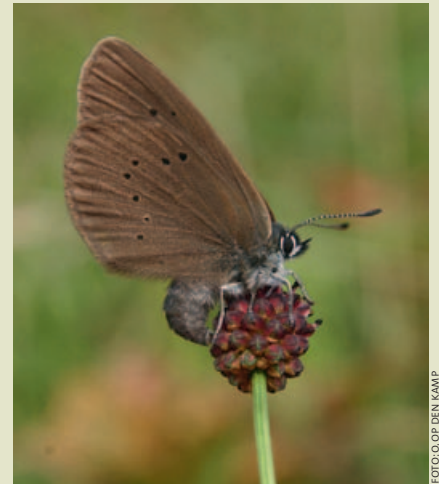
FOTOGRAFIE DEN KAMP

Deze ongewijzigde tweede druk is te bestellen bij het publicatiebureau van het Natuurhistorisch Genootschap, Godsweerderstraat 2, 6041 GH Roermond, tel. 0475-386470 of publicatiebureau@nhgl.nl. Om het boek te bestellen kunt u € 20,00 (leden € 16,00) plus € 8,00 (buitenland € 10,00) verzendkosten overmaken op ING-rekening 429851, voor bestellingen uit het buitenland moet u hiertoe gebruik maken van de IBAN: NL31INGB0000429851 en BIC: INGBNL2A.