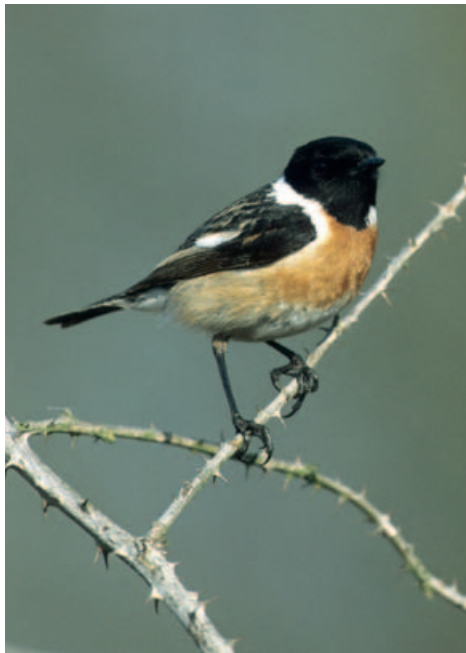
FIGUUR 10 De Roodborsttapuit ( Saxicola rubicola ) is tegenwoordig een algemene verschijning op de Duitse en Nederlandse heidevelden.