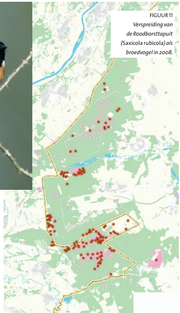
FIGUUR 11 Verspreiding van de Roodborsttapuit ( Saxicola rubicola ) als broedvogel in 2008.

ze ook voor op tot natuur gevormd landbouwgebied grenzend aan bos en heide. Ook het agrarisch grensgebied tussen de Meinweg en Venlo herbergt een grote populatie (HUSTINGS et al. , 2006). In Nordrhein-Westfalen broeden ongeveer 400-500 Roodborsttapuiten (SUDMANN et al. , 2008).