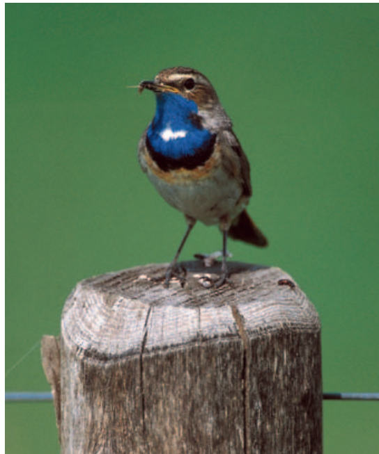
FIGUUR 6 De Blauwborst ( Luscinia svecica ) is gebonden aan een vochtige leefomgeving.

De Boomleeuwerik komt in het natuurreservaat Brachter Wald [figuur 5] overal en in hoge dichtheden voor. Dit is het kerngebied van deze soort in de regio Maas-Swalm-Nette. In het natuurreservaat Elmpter Bruch worden alleen de droge, hogere delen bezet. In de Lüsekamp en het Boschbeektaal wordt de soort ook aangetroffen in droge graslanden en in mindere mate op de droge heide langs de Bosbeek. In andere delen is ze ook te vinden op de kleinere heidevelden, op kaalslagen en in afgravingen.