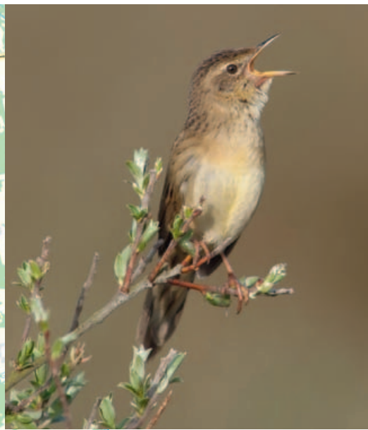
FIGUUR 8 De Sprinkhaanzanger ( Locustella naevia ) wordt op de Meinweg ook in droge hei- deterreinen als broedvogel aangetroffen.