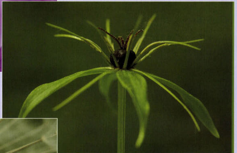
Ecnemum ( Paris quadrifolia ) (foto: P. van Hoof).