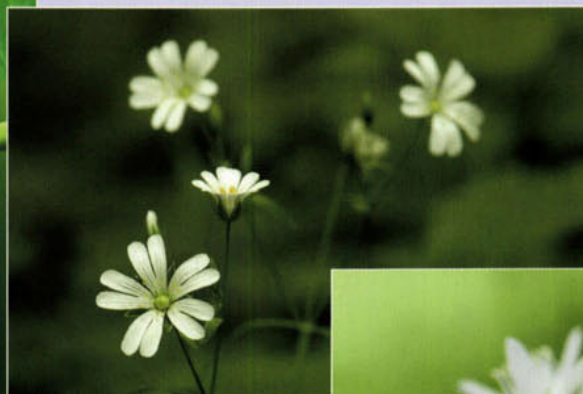
Grote muur (Stellaria holostea).