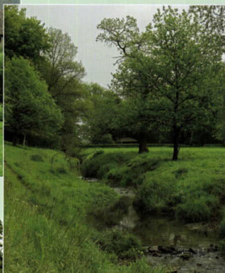
De Eyserbeek (foto: B. Morelissen).