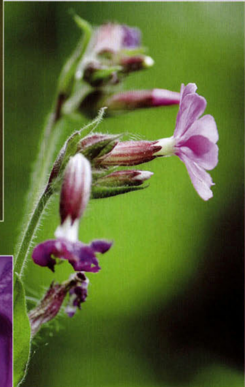
Dagkoekoeksbloem ( Silene dioica ).