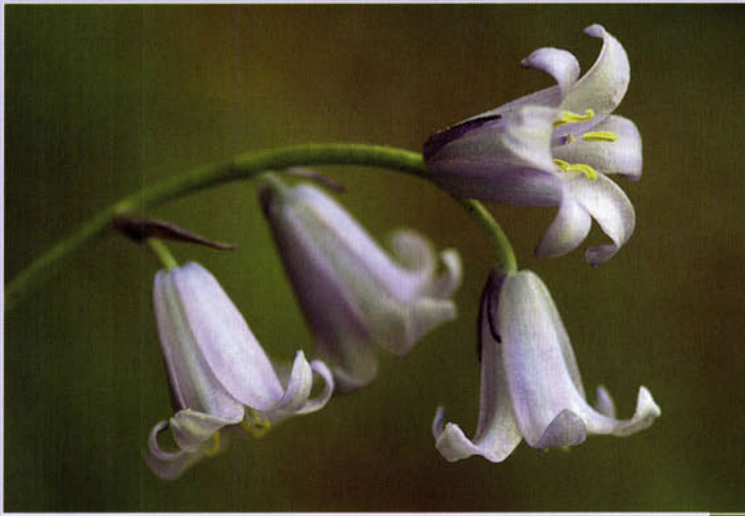
Wilde hyacint ( Hyacinthoides non-scripta ).