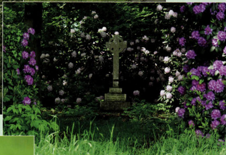
De kasteeltuin.