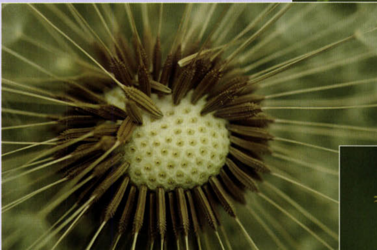
Gewone paardenbloem ( Taraxacum officinale ) (foto: P. van Hoof).