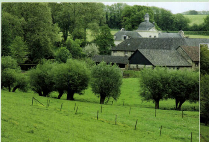
Landgoed Goedenraad.