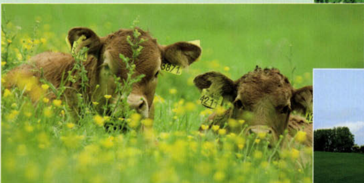
Rundvee in de extensief beheerde graslanden.