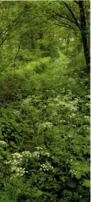
Dichtgegroeide holle weg.