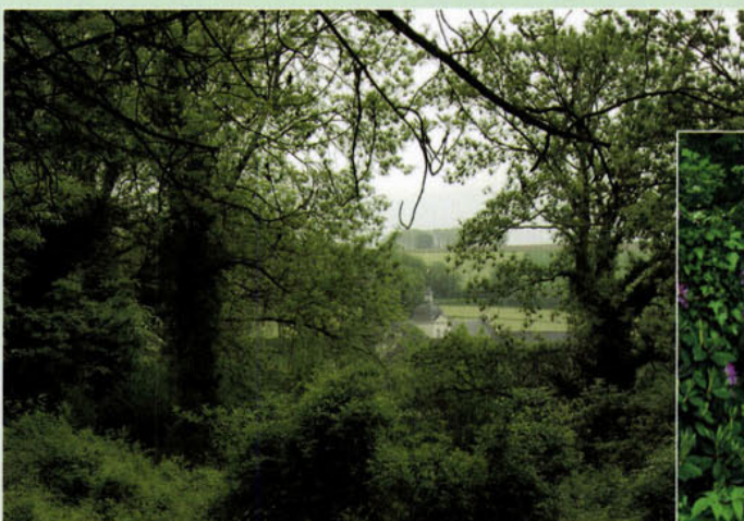
Landgoed Goedenraad.