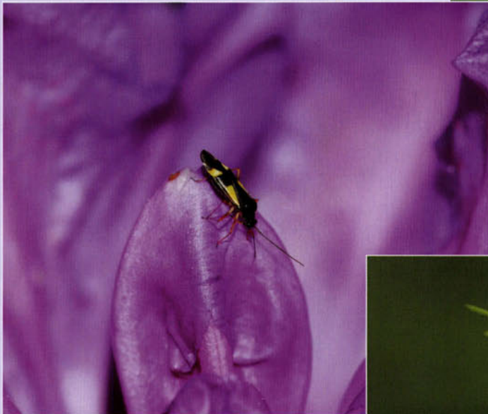
Een Gele viervlek ( Dryophilocoris flavoquadrimaculatus ) op bloeiende Rhododendron.