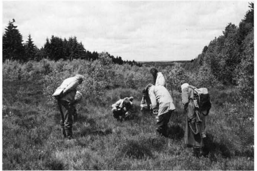
Figuur 2. Het vochtig heideterrein werd grondig bekeken.