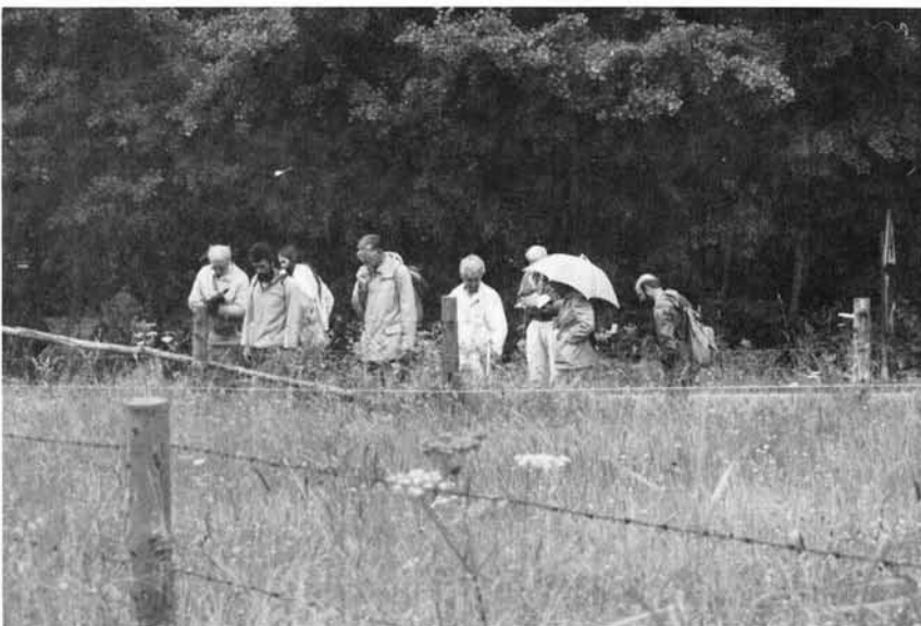
Figuur 3. Vooral de bermen en randen langs de weilanden herbergden nog een relatief rijke flora.