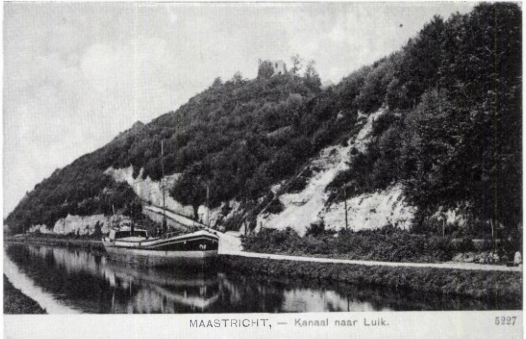
MAASTRICHT, — Kanaal naar Luik.