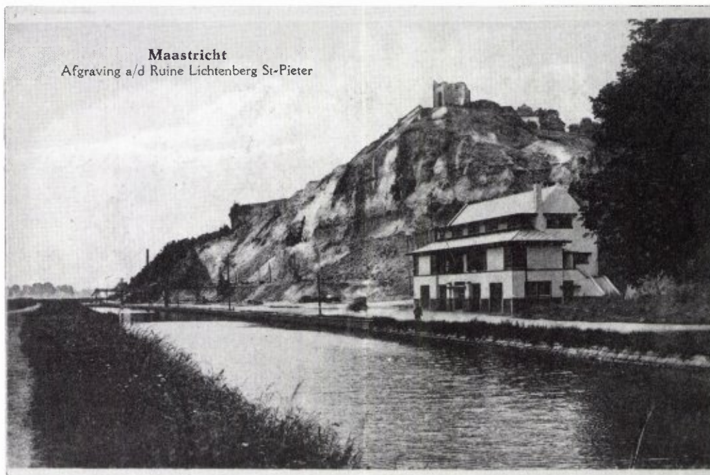
Maastricht Afgaving a/d Ruïne Lichtenberg St-Pieter

Dit begin van het einde is op de derde "ansicht" zichtbaar. Deze recentere prentbriefkaart dateert uit het midden van de jaren 20. De foto is vanuit vrijwel exakt hetzelfde standpunt genomen als de vorige. Zo is ook op deze kaart de ruïne Lichtenberg zichtbaar alsmede, geheel rechts, de grote boom van het buitenterras. Deze kaart spreekt verder voor zich.