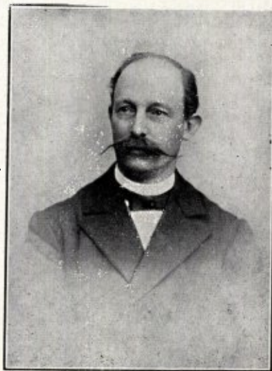
Rolduc's Jaarboek 1929