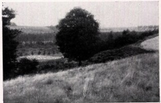
WESTHELLING VAN DEN ST. PIETERSBERG MET UITZICHT OVER HET JEKERDAL 1

Gelukkig is er in zoo'n rijke omgeving nog zeer veel overgebleven, niet het minst op het gebied der flora. Hoe zou dit anders kunnen bij een zoo verscheidenheid van bodem-gesteldheid? In en langs den Jeker vindt men vele waterminnende