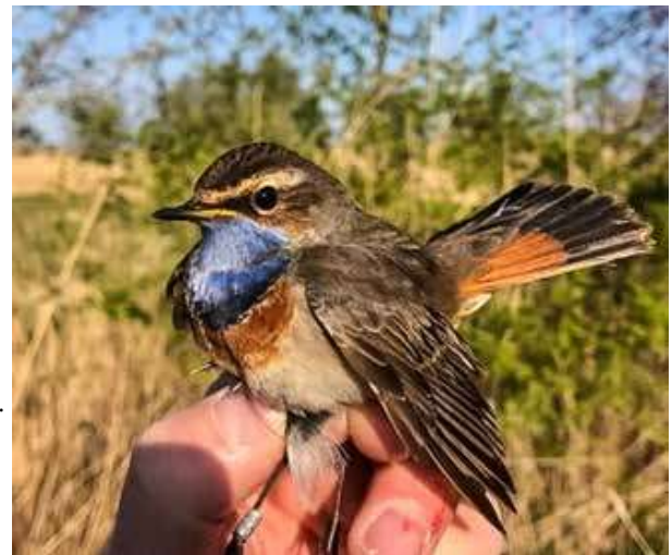
Blauwborst | Marold Brom

Tuinfluiters in de netten, waarvan een die eerder geringd was. Deze terugvangst betrof een Tuinfluiter die op 1 juli 2018 als jonge vogel bij Oud Valkeveen van een ring werd voorzien. Voor beide soorten is het alweer de vroegste datum voor Oud Valkeveen en Oud Naarden zoals te zien in tabel 1. Op andere ringstations werden beide soorten 2-3 dagen eerder gevangen. De Blauwborst van 5 april werd ruim een week later gevangen dan in eerdere jaren. Elders in het Gooi werd hij al een tijdje gehoord.