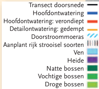
Fig. 2. Bosgebied van de Groote Heide: uitgevoerde maatregelen en te ontwikkelen bos-typen. Aangegeven is het transect van figuur 1.