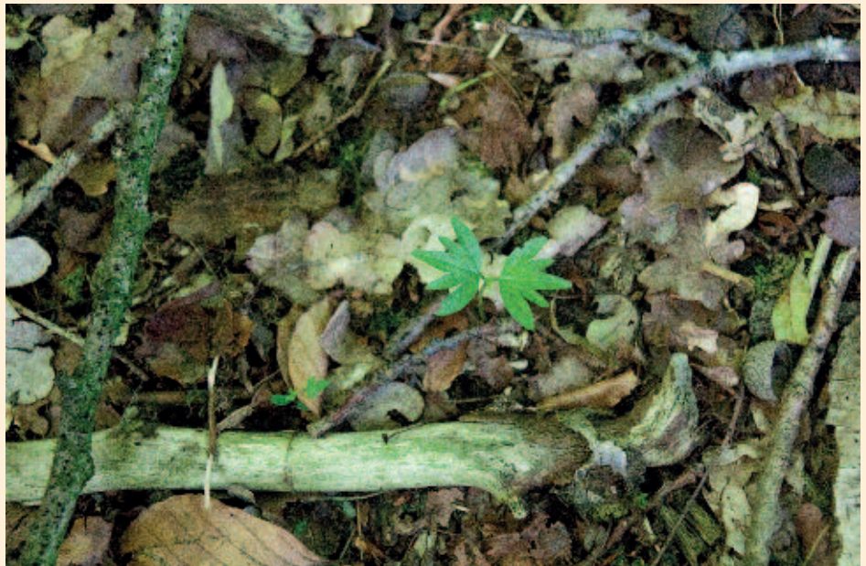
Foto 1. Lindeverjonging in de Groote heide.

Herstel van de biodiversiteit in bossen op zandgronden begint bij het ongedaan maken van de bodemdegradatie en verzuring door herstel van de nutriëntenpomp (Nyssen et al., dit nummer). Één van de middelen om dit te bereiken is verhogen van het aandeel boomsoorten met rijk strooisel. In verdroogde bossen vormt ook herstel van de waterhuishouding een sleutelrol om de zuurbuffering te herstellen (van der Burg et al., 2014). In onderstaand voorbeeld van de Groote Heide bij Heeze worden beide maatregelen op basis van een hydrologische systeemanalyse uitgevoerd.