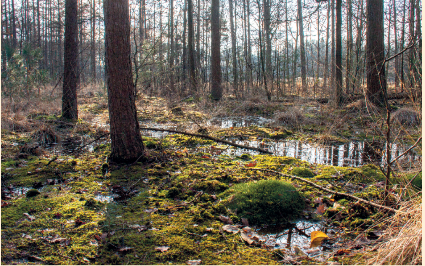
Foto 2. Winterinundatie in een lariksbos. Regenwater wordt vertraagd afgevoerd en in laagten vastgehouden wat een dempend effect heeft op de piekafvoeren. Houtproductie is desondanks nog goed mogelijk.

van Grove den en Ruwe berk ( Betula pendula ). Het is nog te vroeg om te kunnen beoordelen hoe de groei van bomen beïnvloed wordt. Dit kan positief uitpakken door betere vochtvoorziening op de hogere gronden en negatief door een minder bewortelbare diepte op lagere plekken. Momenteel zijn maatregelen die neerslag-extremen als gevolg van klimaatverandering moeten opvangen zeer actueel. Door de hydrologische maatregelen wordt regenwater langer in het gebied vastgehouden. Dit is merkbaar aan de toegenomen oppervlakte die in natte perioden inundeert (foto 2). Het water komt hierdoor geleidelijker beschikbaar en de piekafvoeren worden gedempt. Het bosgebied heeft daarmee zijn waterbergende vermogen ten dele teruggekregen. De mogelijkheden om bossen op hogere zandgronden voor klimaatbuffers en waterretentie te reserveren zijn echter nog weinig onderzocht.