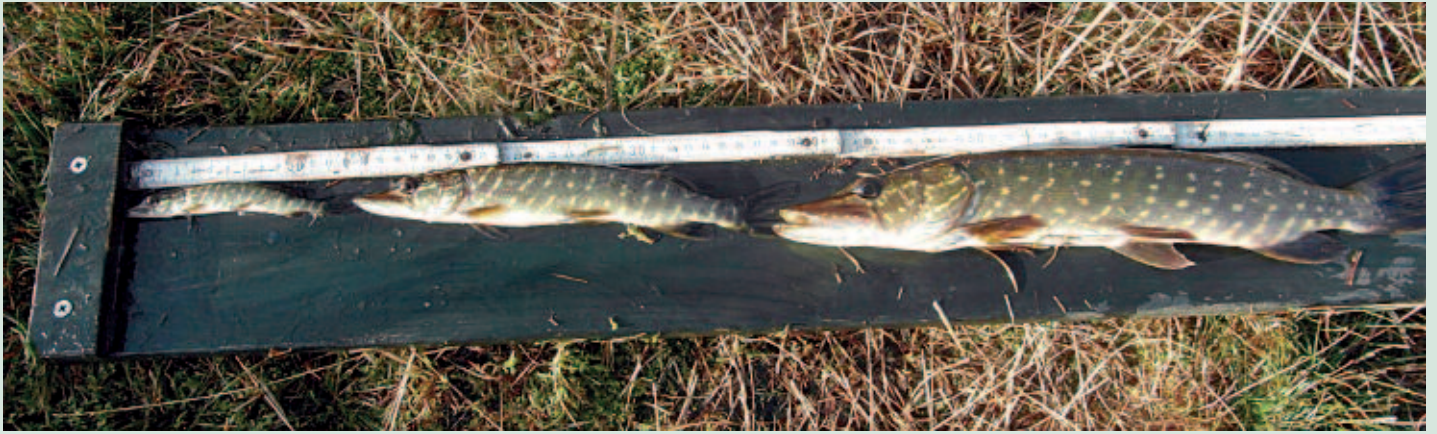
Foto 3. Drie generaties Snoeken uit het Lelieven in 2015 zijn succesvol grootgebracht op een dieet van uitheemse Zonnebaars.

LESA's, zoals analyse van hydrologie, vermistingsbronnen en mogelijkheden om verzuring op te heffen, zijn gebruikt om voor deze wateren te achterhalen welke knelpunten opgeheven moesten worden om ontwikkeling van natuurlijke levensgemeenschap mogelijk te maken. Om te begrijpen waarom Zonnebaars juist in deze wateren invasief is, is daarnaast uitgezocht in hoeverre de visgemeenschap van de wateren in de tijd is veranderd (van Kleef, 2012). Afgelopen eeuw blijkt de visfauna in veel vennen sterk verarmd te zijn als gevolg van verzuring (Leuven & Oyen, 1987). Onze belangrijkste inheemse predator, de Snoek ( Esox lucius ), is nagenoeg verdwenen uit de veelal zure vennen. In vennen waar Zonnebaars domineert is Snoek meestal schaars of afwezig (van Kleef & van Delft, 2012).