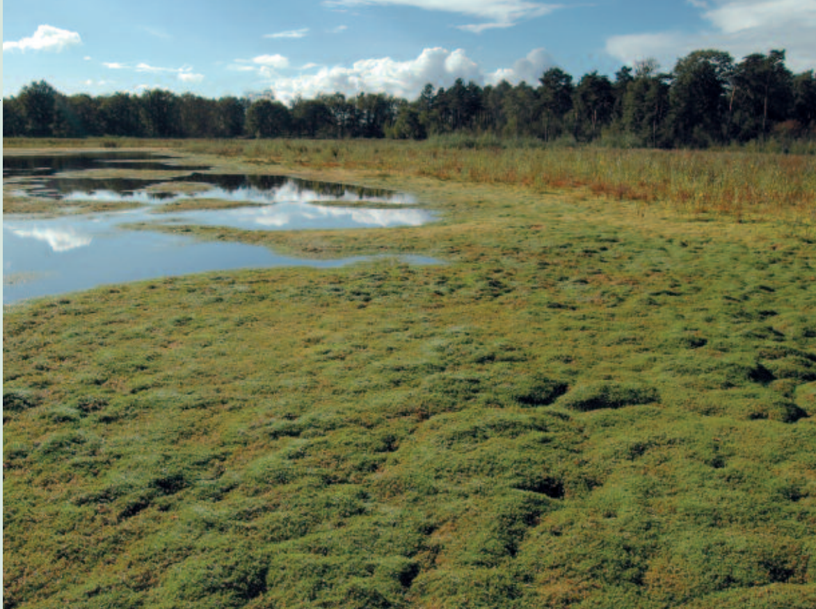
Foto 2. Woekerende Watercrassula op de Brabantse Wal. Bestrijdingsmaatregelen blijken slechts zelden succesvol te zijn (van Kleef et al., 2016).

schap regelmatig kleine gaten, doordat organismen sterven als gevolg van ouderdom of natuurlijke dynamiek. Voor de vrijgekomen plekken geldt in dat geval: 'Wie het eerst komt, wie het eerst maalt'.