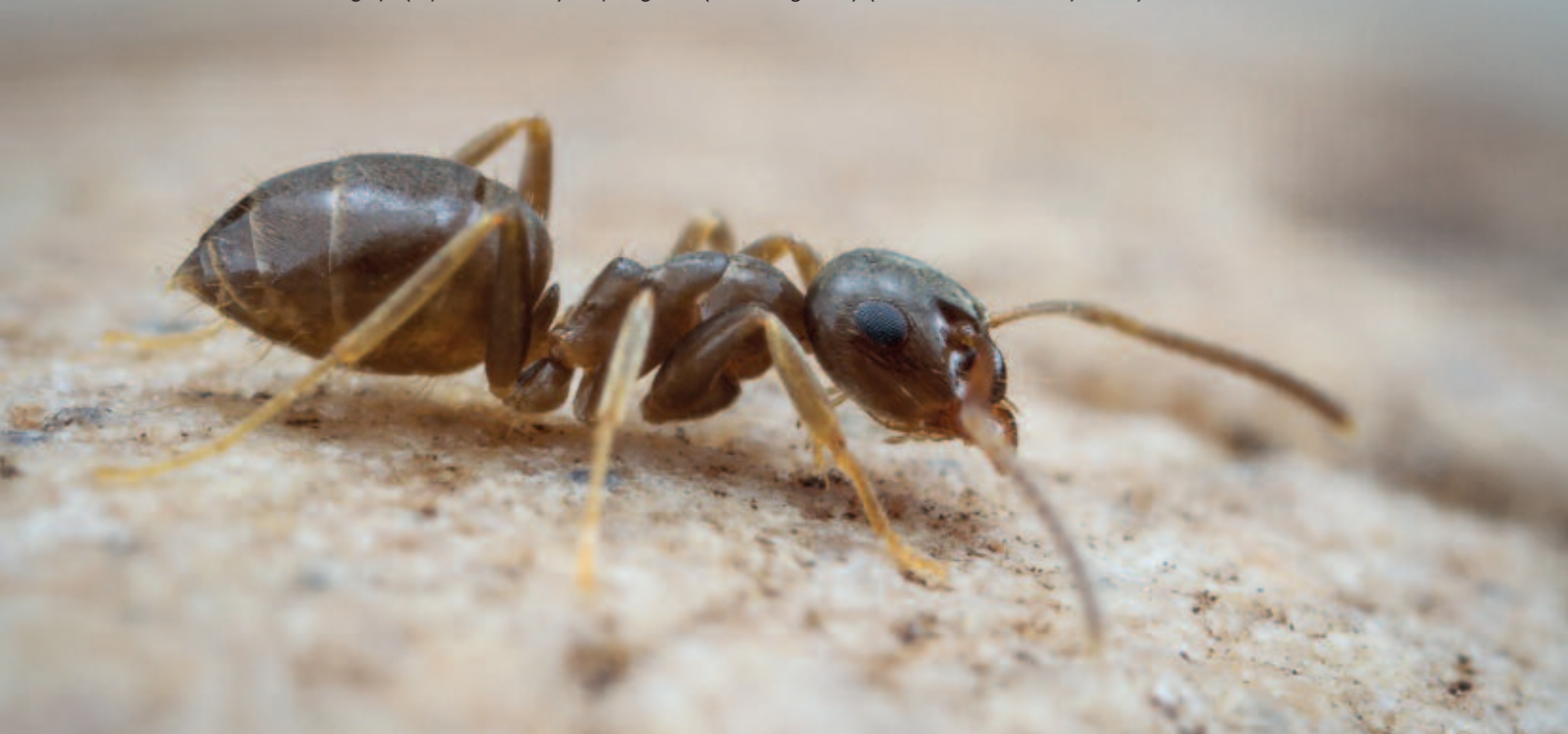
Foto 1. mediterraan kustdraaigatje ( Tapinoma darvii ) en plaagmier ( Lasius neglectus ).

M. Brooks, MSc. Int. Kennis- en Adviescentrum Dierplagen Postbus 350, 6700 AJ Wageningen