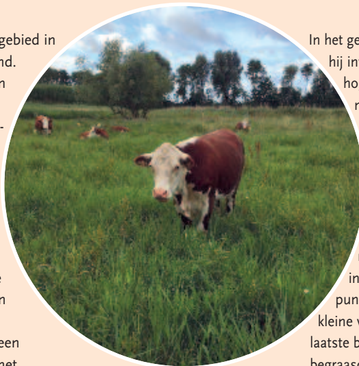
Hereford koeien

Passend bij laag-dynamische deltanatuur wordt een derde van het gebied sinds mei 2016 begraasd met Herefords: een zelfredzaam koeienras, in een gemengde kudde en een deel heeft er jaarrond gelopen. Het begraasde deel bestaat uit gras (60%), bos (25%) en water (15%). Het grasland werd voorheen meerdere malen per jaar gemaaid. Nu, ruim een jaar later, zijn de positieve resultaten van deze verandering in beheer al duidelijk te zien.