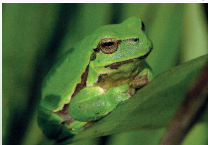
Boomkikker ( Hyla arborea ).

In 2018 wordt onderzoek uitgevoerd naar actuele, verlaten en potentiële boomkikkerleefgebieden van Staatsbosbeheer en geadviseerd over inrichting en beheer. Dit onderzoek wordt eind 2018 afgerond. Uit de voorlopige resultaten blijkt dat veel van de 120 onderzochte voortplantingswateren, die in de afgelopen 25 jaar voor allerlei natuurontwikkelingsprojecten zijn aangelegd, niet