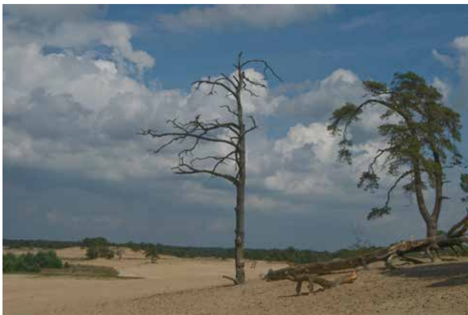
Thijsse: 'Natuurmonumenten hebben pas waarde, wanneer zij waardig bestudeerd worden. Westhoff kreeg onverwachte steun van Van Tienhoven toen hij de Loonse en Drunense Duinen weer wilde laten stuiven.

Westhoff concentreerde zich in zijn eigen onderzoek vooral op het ontwikkelen en beschrijven van de classificatie van de Nederlandse vegetaties. Het leggen van op ecologisch onderzoek gebaseerde relaties met standplaatsfactoren en landschapsprocessen is vooral door anderen ontwikkeld. Als hij daaraan meer aandacht had besteed, zou hij wellicht positiever over de toekomst van de blauwgraslanden hebben kunnen schrijven. Want er gloort toch een lichtpuntje. Het zogenaamde herstelbeheer begint vanaf de jaren negentig vruchten af te werpen. Westhoff ziet dit met eigen ogen, daartoe haast gedwongen door verschillende van zijn leerlingen: lang verdwenen soorten en plantengemeenschappen keren op wonderbaarlijke wijze terug. Dat had hij niet voor mogelijk