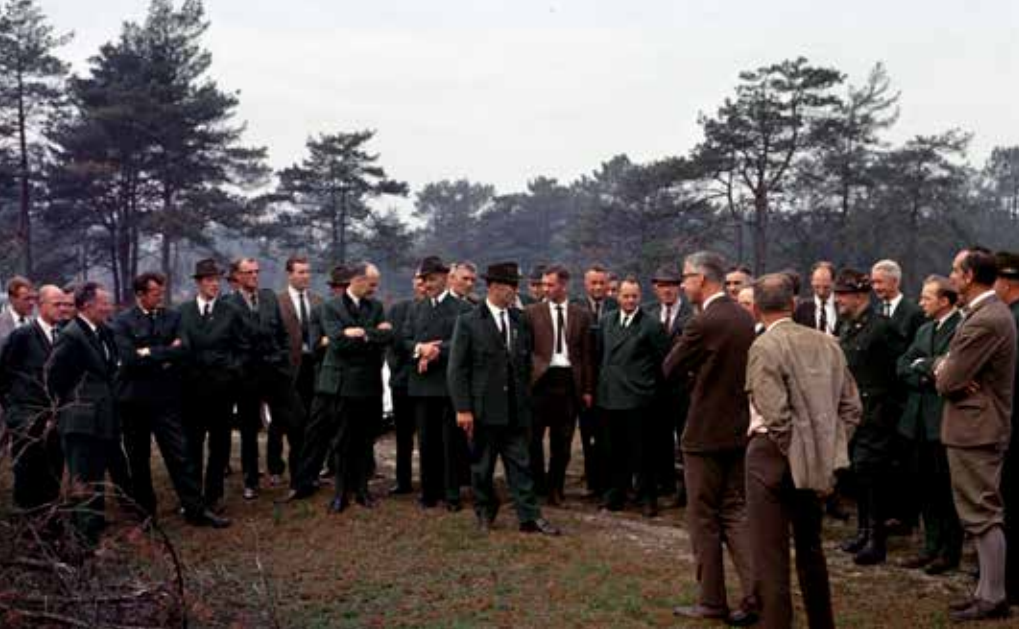
Natuurbescherming in Nederland is lange tijd een typisch hecht mannenbolwerk. Boswachtersexkursie in 1967 in de Loonse en Drunense Duinen.

gehouden en het geeft hem nieuwe moed. Hij is zich echter amper bewust van de dan opgetreden contradictie: de natuurbeschermer die lyrisch over de tuin van Holland kon vertellen, maar anderzijds krampachtig blijft waar het gaat om de potenties bij ontwikkeling van natuur. En dat staande op hersteld blauwgrasland, een van zijn onvervangbare Twentse schatten. Hier bleek dat als de omstandigheden, de standplaatsfactoren, maar juist en passend zijn verbeterd ook dit zeldzame vegetatietype zich laat herstellen.