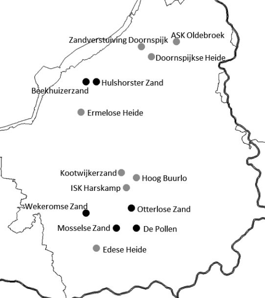
Fig. 1. Overzicht onderzoeksterreinen. Terreinen waar in detail is gekeken naar nestgelegenheid, vegetatiestructuur en geleedpotigenfauna zijn zwart gemarkeerd, terreinen waar alleen naar de aanwezigheid van territoriale tapuiten is gekeken zijn grijs gemarkeerd.

detail gekeken naar de nestgelegenheid, de vegetatiestructuur en de samenstelling van de geleedpotigenfauna.