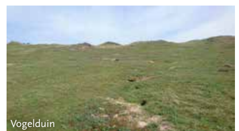
Foto 2. Totale nestgelegenheid in drie plots (elk 1 ha) per detailgebied op de Veluwe en in het Vogelduin.

(fig. 2, rechts), een reden om insecten op verschillende manieren te bemonsteren. Gemiddeld werden 487 \pm 222 individuen gevangen per terrein op de Veluwe. De aantallen gevangen geleedpotigen variëren sterk tussen de zes Veluwse gebieden: de kleinste aantallen individuen zijn aangetroffen op het Otterlose Zand (n=233) en de grootste op het Mosselse Zand (n=819). Toch verschilt de relatieve samenstelling van ordes nauwelijks tussen deze twee gebie-