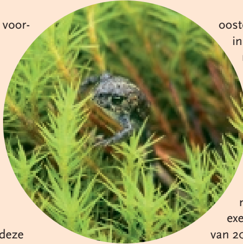
Rugstreeppad juveniel

Vanaf 2011 is ook het Dwingelderveld in trek en wordt er door de populatie vooral positief gereageerd op de forse herstelwerkzaamheden aan de waterhuishouding. Er ontstonden ook hier nieuwe voortplantingswateren en meer geschikt winterhabitat in de vorm van schaars begroeiende vergraafbare bodems. De sterk groeiende populatie op het Dwingelderveld lijkt recent over de wijdere omgeving uit te zijn. In het Nuilerveld, vijf kilometer