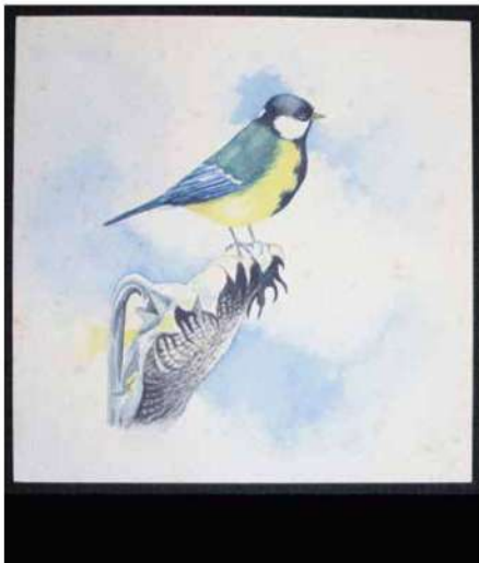
Koolmees ca. 1965