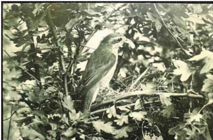
Grauwe klauwier vrouw Nederhorst den Berg, 1948