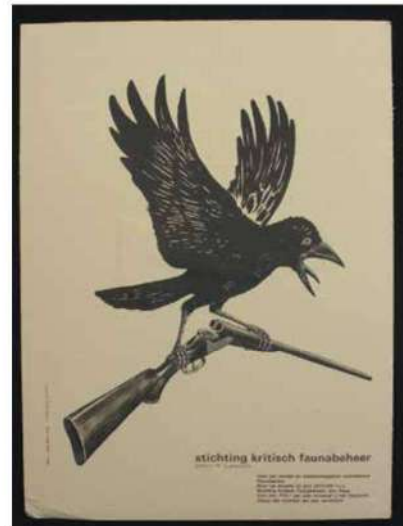
Affiche Stichting Kritisch Faunabeheer tekening E. Boeve