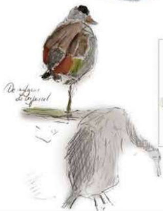
Reifvogel de l'opinel