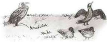
broedstok sint Wald