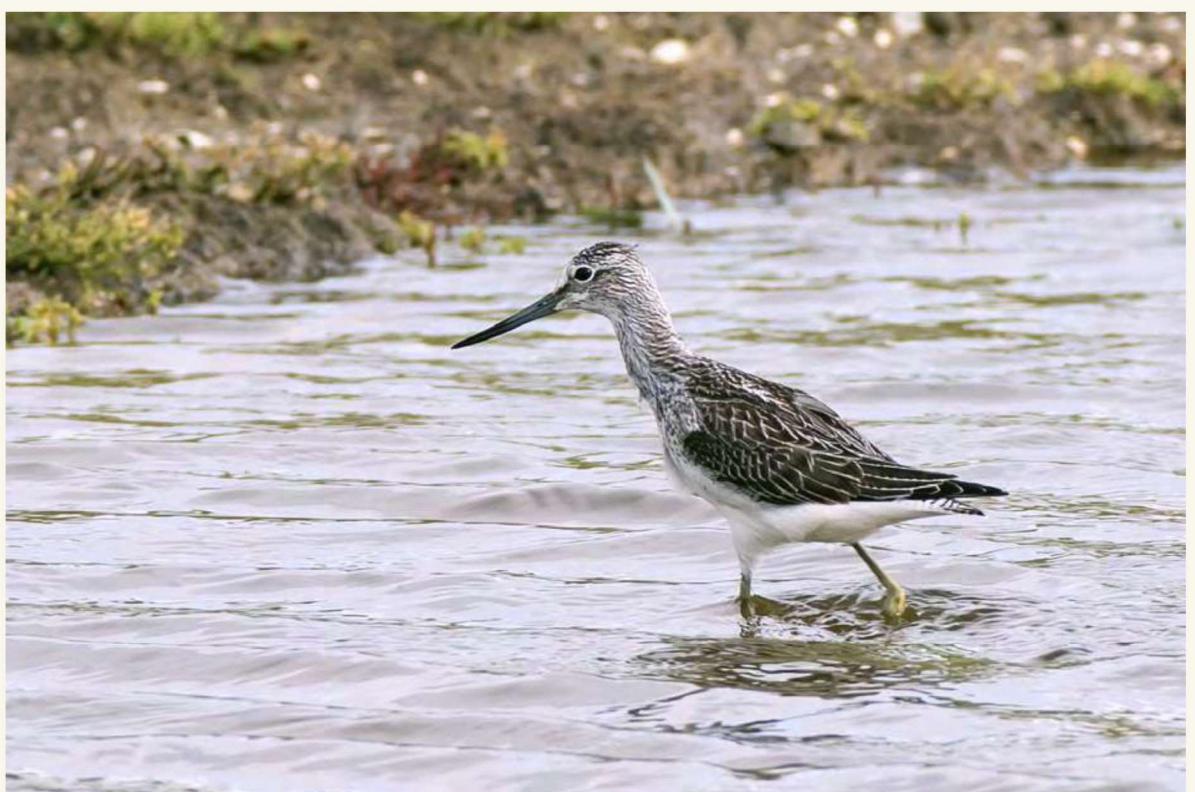
groenpootruiter Bert Roelofs