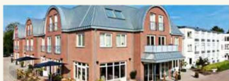
Hotel De Pelikaan, De Koog

Door werkzaamheden aan de Waddenzeedijk was de Lancasterdijk tussen Nieuweschild en De Cocksdorp afgesloten. Hierdoor waren de natuurgebieden Wagejot en Utopia niet bereikbaar.