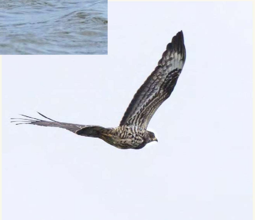
wespendief Bert Roelofs

Tijdens één van de excursies werd op het wad een vreemde, onbekende vogel aangetroffen. Het beest was langwerpig had een lange snavel en 10 poten waarvan zes dunne poten. Raadplegen van vogelgids en vogel-app leverde geen duidelijkheid op. Uiteindelijk bracht een telescoop de oplossing.