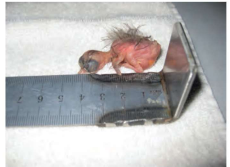
foto 2. Zelfs net uitgekomen vogels worden grootgebracht.

De terugmeldingen vertellen ons onder andere iets over hun overlevingskansen. Verder bijvoorbeeld waar en hoe ze zijn aangetroffen, wanneer er een melding van een dood of levend exemplaar is doorgegeven aan het Vogeltrekstation in Wageningen. Een voorbeeld is de melding van een jonge kleine mantelmeeuw, die