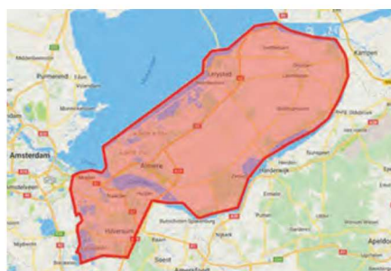
Figuur 1. Het officiële verzorgingsgebied.

verzorgen en te revalideren. Het areaal dat bestreken wordt omvat de provincie Flevoland en de Gooi- en Vechtstreek. Het gaat vaak om soorten met verwondingen, die van diverse aard kunnen zijn. Herstelde niet gedomesticeerde vogels worden weer uitgezet. Voorwaarde hierbij is, dat een zelfstandig leven in de natuur haalbaar wordt geacht voor de vogel. Het Vogelhospitaal is in de loop der jaren uitgegroeid tot een professionele organisatie. Het wordt gerund door een operationeel team, dat geleid wordt door de beheerder. Jaarlijks worden meer dan 5500 vogels opgevangen, waarvan de meeste weer vrijgelaten kunnen worden. Het aantal vogels dat wordt opgevangen