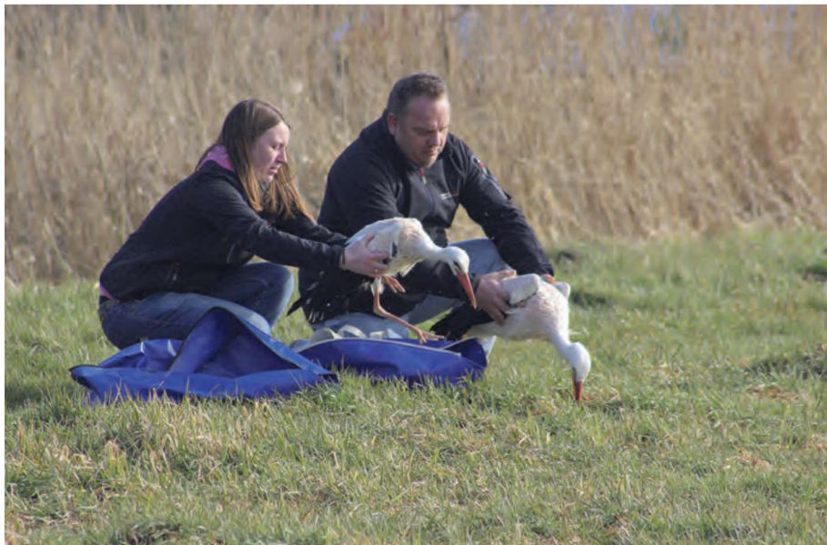
foto 1 Vogels die worden losgelaten krijgen een ring om een poot voor onderzoek.

Erik: In het broedseizoen gaat het vooral om verstoorde broedsels van nog niet vliegvlugge jongen. Dat zijn vogels, die net uit het ei zijn gekropen of halfwas vogels, die dan door de vrijwilligers met regelmaat (soms elk uur) moeten worden gevoerd. Ook net uitgevlogen jonge vogels worden veel gebracht. Hieronder nogal wat exemplaren, die door toedoen van katten gewond zijn geraakt. Slachtoffers van maai- en oogstwerkzaamheden komen ook nog steeds voor. Verder veel aanvaringslachtoffers door transparante