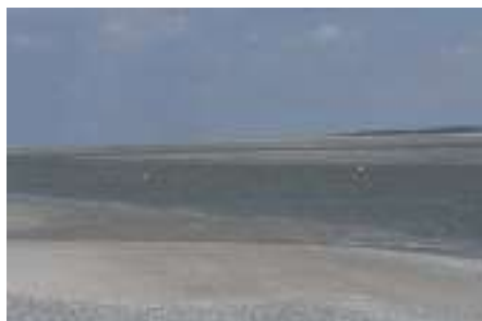
De Somme delta bij eb