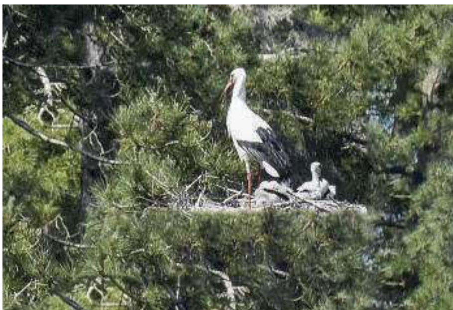
Ooievaar met paling probeert jongen te voeren