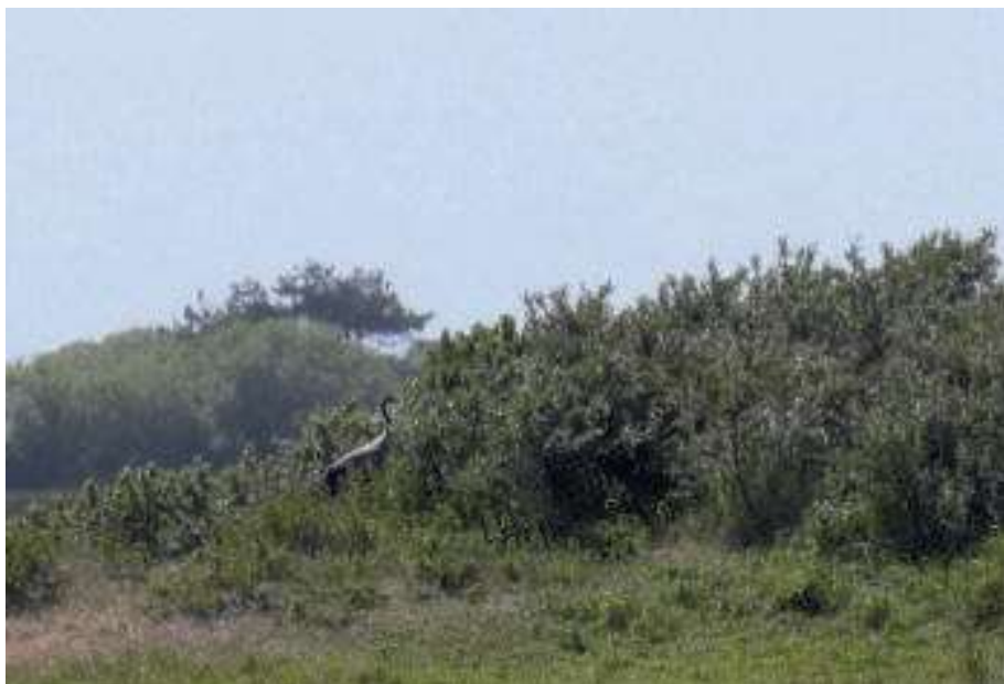
Nog net te zien, de kraanvogel