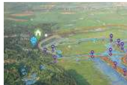
Indeling van het park, de entree, het panorama en de vogelobservatiehutten

Als je naar het zuiden van Frankrijk rijdt en je wilt daar de drukke snelwegen een keer mijden, kies dan een alternatieve route, weg van de snelweg. Neem bijvoorbeeld de kustweg langs Het Kanaal die min of meer regelrecht naar de monding van de rivier de Somme voert. Zo kan je tijdens de reis meer van het Franse landschap genieten. Alleen, als je in zuidelijke richting rijdt, wel even links blijven kijken ter hoogte van Duinkerken en Calais vanwege de horizonvervuiling rechts. De Somme ontspringt bij Fonsomme in het departement Aisne en de delta van de Somme mondt uit in Het Kanaal. Het Gooi ligt op ongeveer 450 km afstand van de monding.