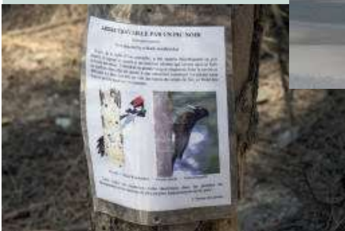
Aangetaste den door de zwarte specht Ongerepte delta van de Somme Le Crotoy aan de noordelijke oeverpunt van de Somme

Tabel: In het ornithologisch 'Parc du Marquenterre' zijn de laatste paar jaar ca. 300 soorten trekvogels gespot en ook een groot aantal vogels geringd.