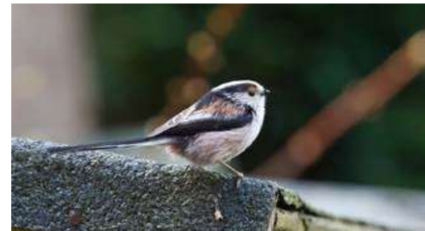
Staatmees | Wim Smeets

"Mijn vriend dacht/hoopte dat dit een Witkopstaartmees was, maar volgens meerdere ervaren vogelaars is het dit waarschijnlijk niet. Het wit van het kopje lijkt niet contrasterend en 'sneeuwwit' genoeg en tevens vanwege de vlekjes achter het oog en in de hals. Het wordt dan een Witkoppige Staartmees genoemd."