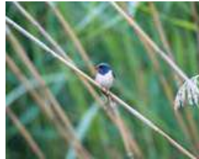
Boerenzwaluw | Jaap Bikker