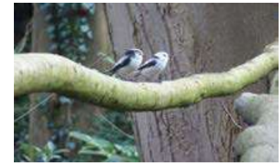
Staatmees en Witkoppige Staatmees | Theo Steur

Een dag later zit ik aan mijn tafel te werken achter mijn laptop en kijk even op en uit mijn raam: twee Staartmeesjes op het iele boompje dat daar staat. Twee maar. Meestal zie je ze in grotere families snel en rusteloos foerageren onder het voortdurend uiten van ijle roepjes. Ik ben al lang blij: wat een leuke,