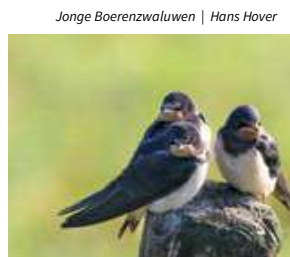
Jonge Boerenzwaluwen | Hans Hover