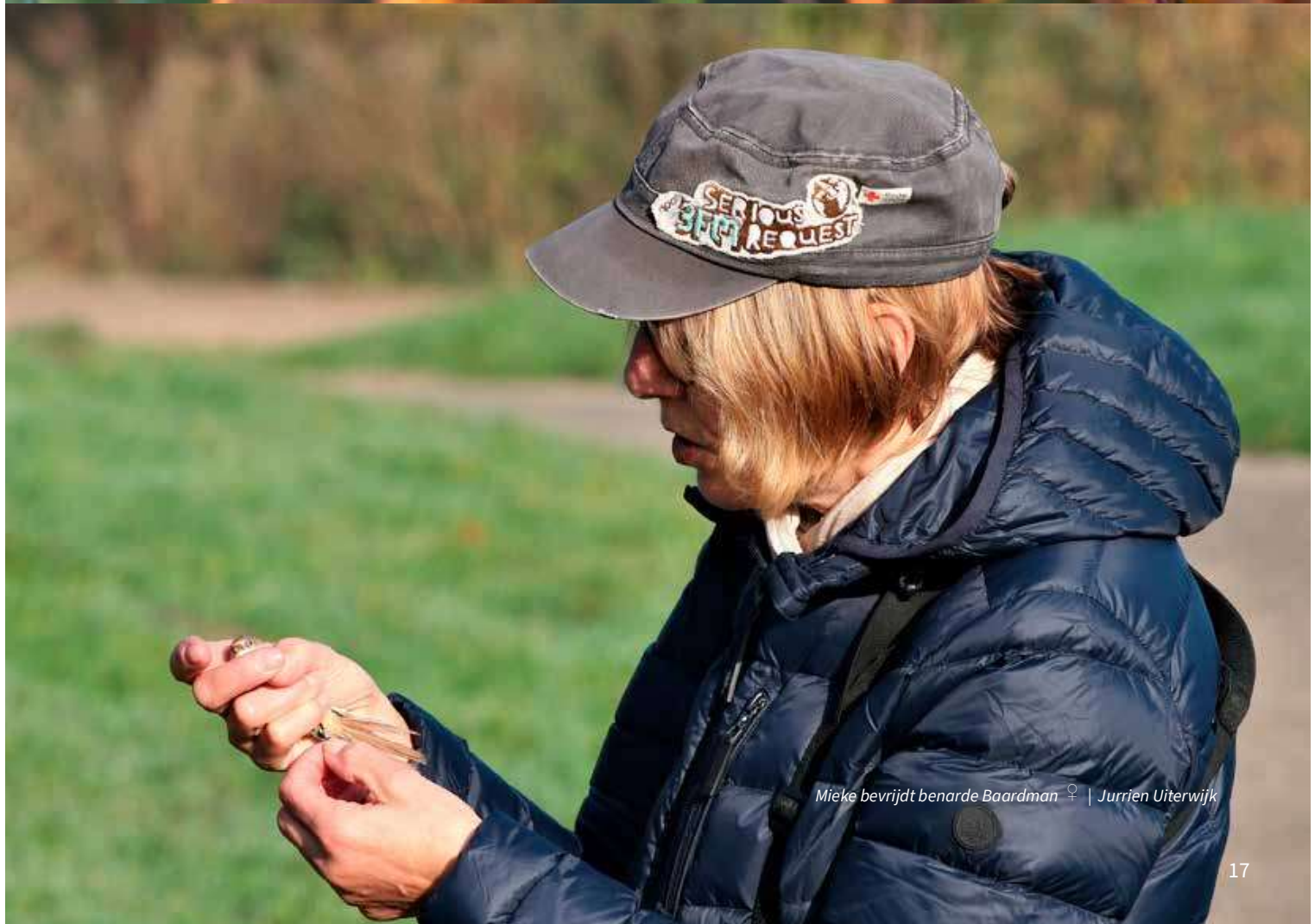
Mieke bevrijdt benarde Beardman ♀ | Jurrien Uiterwijk