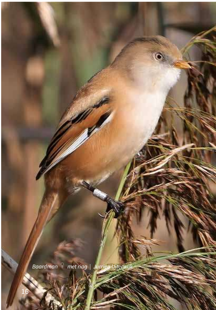
Baardman ♀ met ring | Jurrien Uiterwijk

Op de terugweg zag ik nog wel een mannetje Baardman heel mooi vrij zitten en kon het niet laten om daar een paar foto's van te maken. Ook nog een ander geringd vrouwtje op de foto gekregen die samen met het mannetje optrok. Helaas is ook deze ring niet volledig afleesbaar.