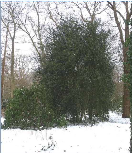
Figuur 1 Typische schuilplaats voor Houtsnippen op landgoed Offem, februari 2021.

Vele miljoenen Houtsnippen broeden in de uitgestrekte bossen van Noord- en Oost-Europa. In het najaar trekken zij massaal naar het westen om te overwinteren. De Britse Eilanden en West-Frankrijk vormen traditioneel de belangrijkste bestemmingen. De winters zijn echter milder geworden waardoor steeds meer snippen de oversteek naar Engeland niet meer maken en op het vasteland blijven. Maar als koning winter dan toch een keer toeslaat komt de westwaartse trek weer op gang. Steeds meer vogels gokken erop dat het winterse weer van korte duur is en nemen de risicovolle overtocht naar Engeland niet meer. Met de Noordzee als barrière komen de Houtsnippen dan