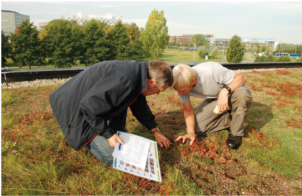
2. De 'nationale bodemdierendag' op 4 oktober 2015 werd live uitgezonden door Vroege Vogels Radio. 2. The 'national soil animal day' on October 4th 2015 was broadcasted live by Vroege Vogels Radio.