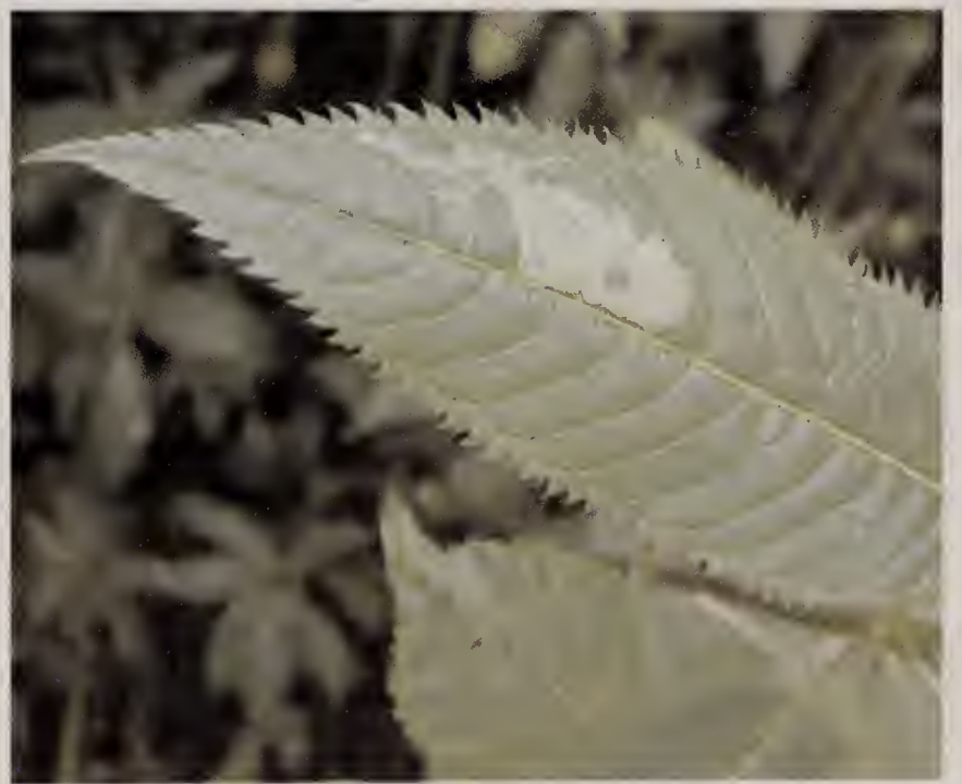
Figuur 1. Mijne van Phytoliriomyza melampyga op reuzenbalsemien.

Op 25 juli 1986 verzamelde de tweede auteur bladmineerders op Astragalus glycyphyllos L. (hokjespeul) in Stokkem, bij Schin op Geul. Hoewel de mijnen al verlaten waren konden ze door hem met behulp van de tabel van Hering (1957) gedetermineerd worden als Phytoliriomyza (toen nog Liriomyza ) variegata (Meigen). Het lijkt wat laat om dit nu te publiceren, maar deze soort was toen nieuw voor de Nederlandse fauna en is nadien nog niet teruggevonden in ons land. De soort is bekend uit België (De Bruyn & von Tschirnhaus 1991), Scandinavië, Denemarken (Spencer 1976), Duitsland (Von Tschirnhaus 1999), Polen (Nowakowski 1954) en Dalmatië (Buhr 1930). Volgens Hering (1967) is de soort in Midden-Europa zeer talrijk, zowel op Astragalus als op Colutea arborescens L. (blazenstruik). Deze laatste wordt vaak aangeplant in plantsoenen en het loont misschien de moeite om daarop naar P. variegata -mijnen uit te kijken. Ook Lathyrus sylvestris L. (boslathyrus) wordt wel als waardplant genoemd (Spencer 1976).