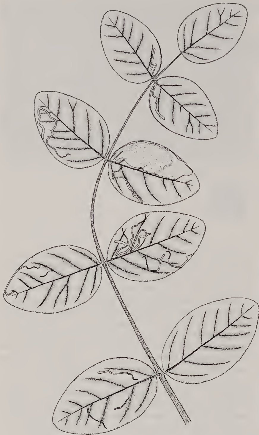
Figuur 2. Mijnen van Phytoliriomyza variegata op een blad van hokjespeul. Op één na zijn alle mijnen niet verder ontwikkeld dan het stadium van de begingang. Tekening: J.C. Koster.

Mines of Phytoliriomyza variegata on a leaf of wild liquorice. All but one mines have not developed beyond the stage of the initial corridor.