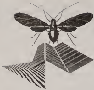
Figuur 1. Het SETE-logo. SETE's logo.