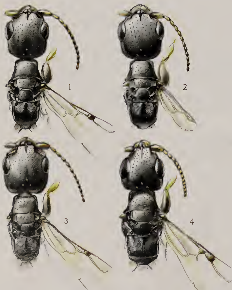
Figuur 3. Vrouwtjes van Bethylus fuscicornis , langvleugelige vorm (1) en kortvleugelige vorm (2). Bethylus cephalotes (3) en Goniozus tibialis (4); bovenzijde van kop en borststuk.

Of de verschuiving in vleugellengte een cyclisch proces is kan alleen worden getoetst aan de praktijk. Inmiddels is op het bewuste zandterrein in Lelystad het woon- en lifestyle -paradijs Palazzo verzezen en zijn ook de meeste andere ideale zandvlakten van Flevoland in cultuur gebracht voor stadsuitbreiding, wegenbouw of recreatie. Verder veldonderzoek is hier voorlopig dus onmogelijk. Gelukkig is de provinciale organisatie voor natuurbeheer, Stichting Flevoland , enkele jaren geleden begonnen met de aanleg van 'nieuwe natuur' voor zandbewoners. Aan de zuidzijde