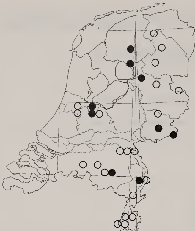
Figuur 1. Verspreiding van Cryptocephalus decemmaculatus in Nederland. Open cirkels = vondsten tot 1950, gesloten cirkels = vondsten sinds 1950.

Distribution of Cryptocephalus decemmaculatus in The Netherlands. Open circles = records before 1950, solid circles = records since 1950.