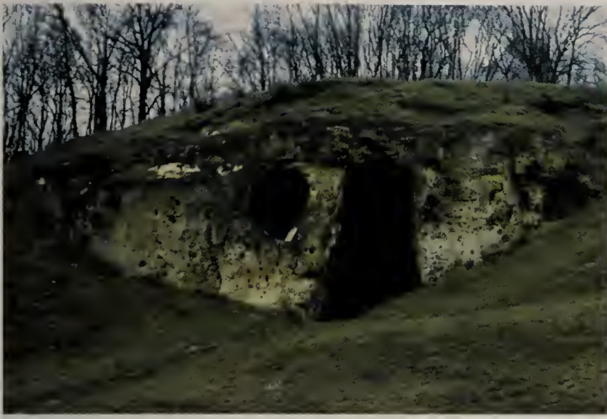
Figuur 3. Ingang van de Duivelsgrot op de Sint-Pietersberg waar Longitarsus ballotae ontdekt werd in januari 2001. Entrance to a marl cave in the Sint-Pietersberg, Limburg, where Longitarsus ballotae was discovered in January 2001.