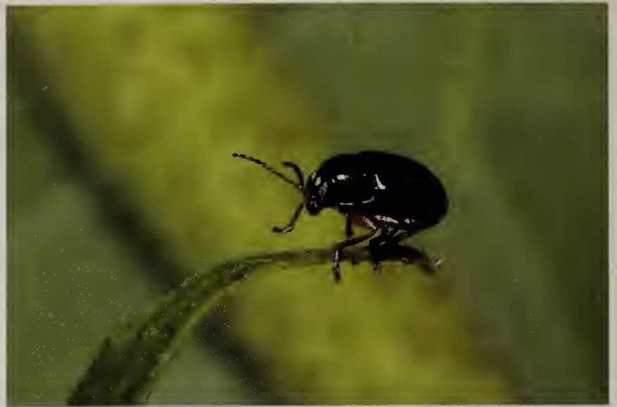
Figuur 2. Cryptocephalus ocellatus .

Van slechts enkele Nederlandse bladkeversoorten is aangetoond dat de kevers zich voeden met zowel Salicaceae als Rosaceae: Cryptocephalus octopunctatus (Scopoli), C. sexpunctatus (Linnaeus), C. flavipes Fabricius, Clytra quadripunctata (Linnaeus) en Luperus longicornis (Fabricius). Opvallend bij deze soorten is dat de larven zich niet voeden met het verse blad van de planten waarvan de adulten eten. De larven van Clytra leven in mierennesten en voeden zich daar met dode planten- en dierenresten; de larven van Cryptocephalus voeden zich met dood organisch materiaal op de bodem; de larven van Luperus voeden zich met de wortels van grassen. Mogelijk dat daarin de minder specifieke voedselkeuze van de kevers gelegen is. Van een andere bladkever, Chrysomela lapponica Linnaeus, waarvan zowel kevers als larven zich voeden met verse bladeren van berk ( Betula sp.) en wilg zijn grote aantallen adulten te Soest aangetroffen op lijsterbes ( Sorbus aucuparia ), eveneens een soort van de Rosaceae (Beenen 1985). Er is daar echter niet vastgesteld of deze kevers ook daadwerkelijk het blad van de lijsterbes consumeerden.