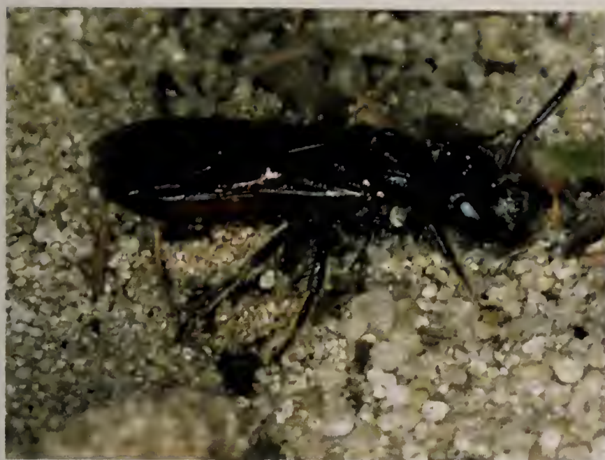
Figuur 1. Bloedbij Sphecodes monilicornis , man. Male Sphecodes monilicornis .