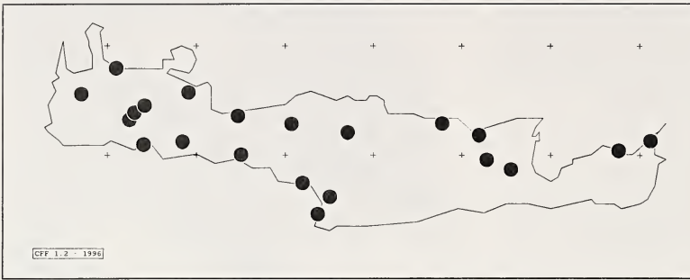
Fig. 8. Carte de distribution de Ceratina teunissenii spec. nov. (Crète).

Etats membres des Communautés européennes et du Conseil de l'Europe : 1-78. Office des publications officielles des Communautés européennes, Luxembourg.