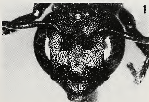
Fig. 1. Ceratina teunissenii spec. nov., ♀, Chora Sfakion, tête vue de face.

Holotype: ♂, Meskla (35°23'N 23°58'E), 3.v.1973, leg. H. Teunissen (NNM). Etiquetage de l'holotype: "W.