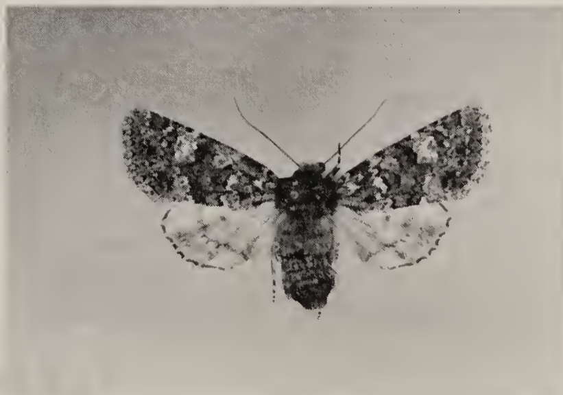
Fig. 1. Eumichtis lichenea (Hübner), ♀, Bergen (NH), 29.ix.1990.

moeden uit dat er al in 1966 een populatie op het naburige Ameland aanwezig moet zijn geweest. De vangsten uit Ternaard kunnen betrekking hebben op zwervers, die de Waddenzee zijn overgestoken. Het bestaan van een dergelijke populatie werd pas in 1984 bevestigd. Toen werden tussen 8 en 10 september vier exemplaren bij het dorp Buren aangetroffen door J. H. Donner. Dit waren de eerste vangsten van een lange reeks. Inmiddels is gebleken dat zich op Ameland een grote, vitale populatie bevindt. Dit blijkt ook uit de waarneming van \pm 60 exemplaren tussen 15 en 20 september 1985 door Th. Heijerman. Op Ame-