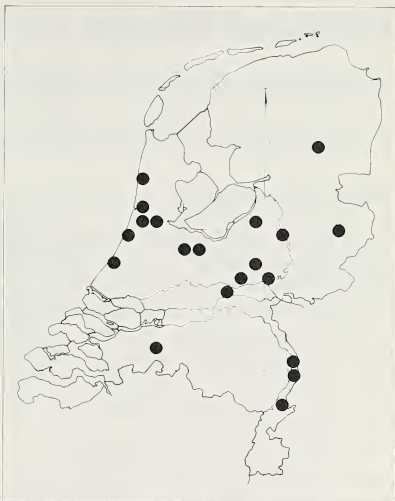
Fig. 3. Verspreiding van Psallus confusus in Nederland, gebaseerd op met zekerheid gedetermineerde mannetjes.